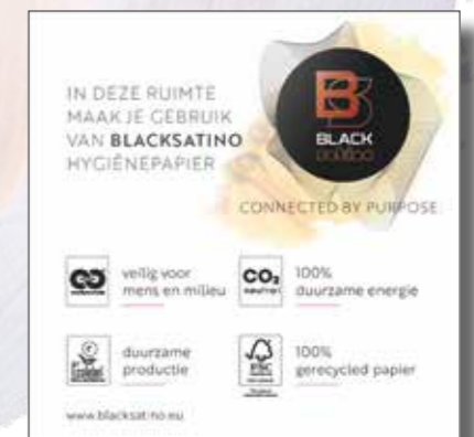
• Communicatieschildjes toiletruimte